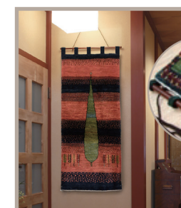
▲加工して壁掛けに