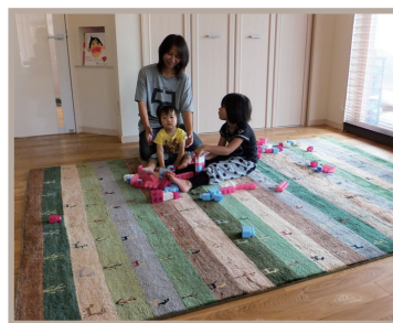
▲広く全体に敷いた例

そして何十年もお使いのうちに「ライフスタイルが変化」して行くことも…家族が増えたり、成長につれ、「もっと大きなサイズ」にしてあげれば「良かった」とのお声も伺います。