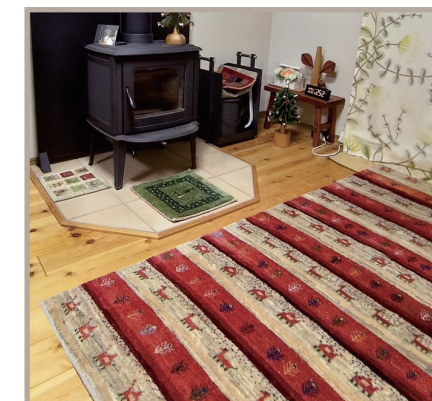
▲難燃性で暖炉・ストーブ前にも安心