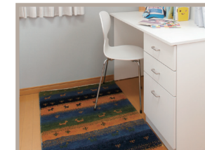
▲防音効果があるので子供部屋にもぜひ