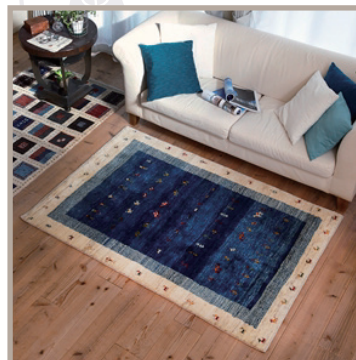
▲ソファサイズに合せた例

楽そうな座り姿勢も長時間になると、疲れを感じた経験がきっとあるはず。そんな時、大きめサイズを全体に広く敷いてあれば、使い方を限定せずに「上に座ったり、ゴロゴロしたり」自由に過ごせます。